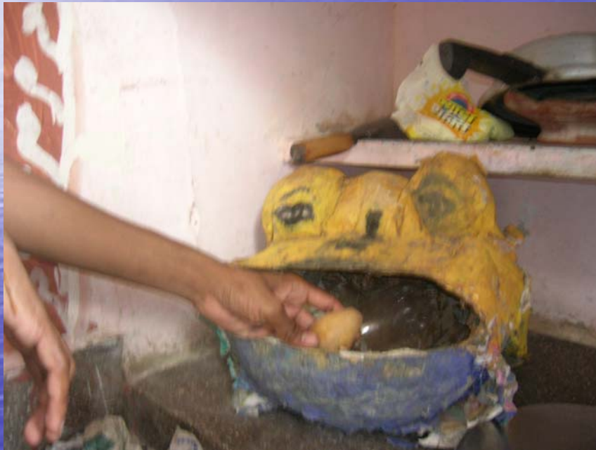
paper mache container