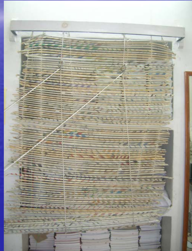
paper yoga curtain